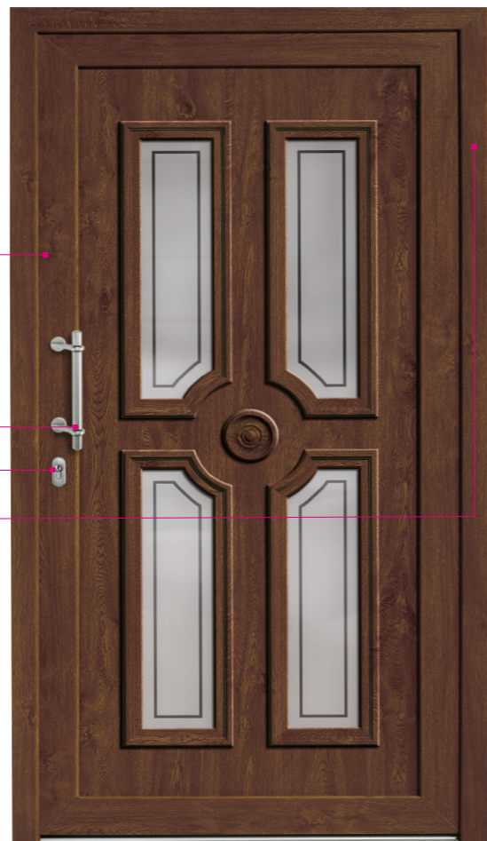
Model vchodových dveří prezentovaný v třídě GOLD

Vchodové dveře EUROCOLOR, vyrobené z jakostního PVC nebo RAU-FIPRO®, spojují vysokou kvalitu s moderním designem. Všechno je tak, aby byl zajištěn elegantní vchod do každého domu. Pouze vchodové dveře z PVC nebo RAU-FIPRO® zajišťují tak spojitou tvarovou a barevnou harmonii s okny na fasádě budovy. Výrobek je dostupný ve 4 různých třídách (Bronze, Silver, Gold, Gold Plus).