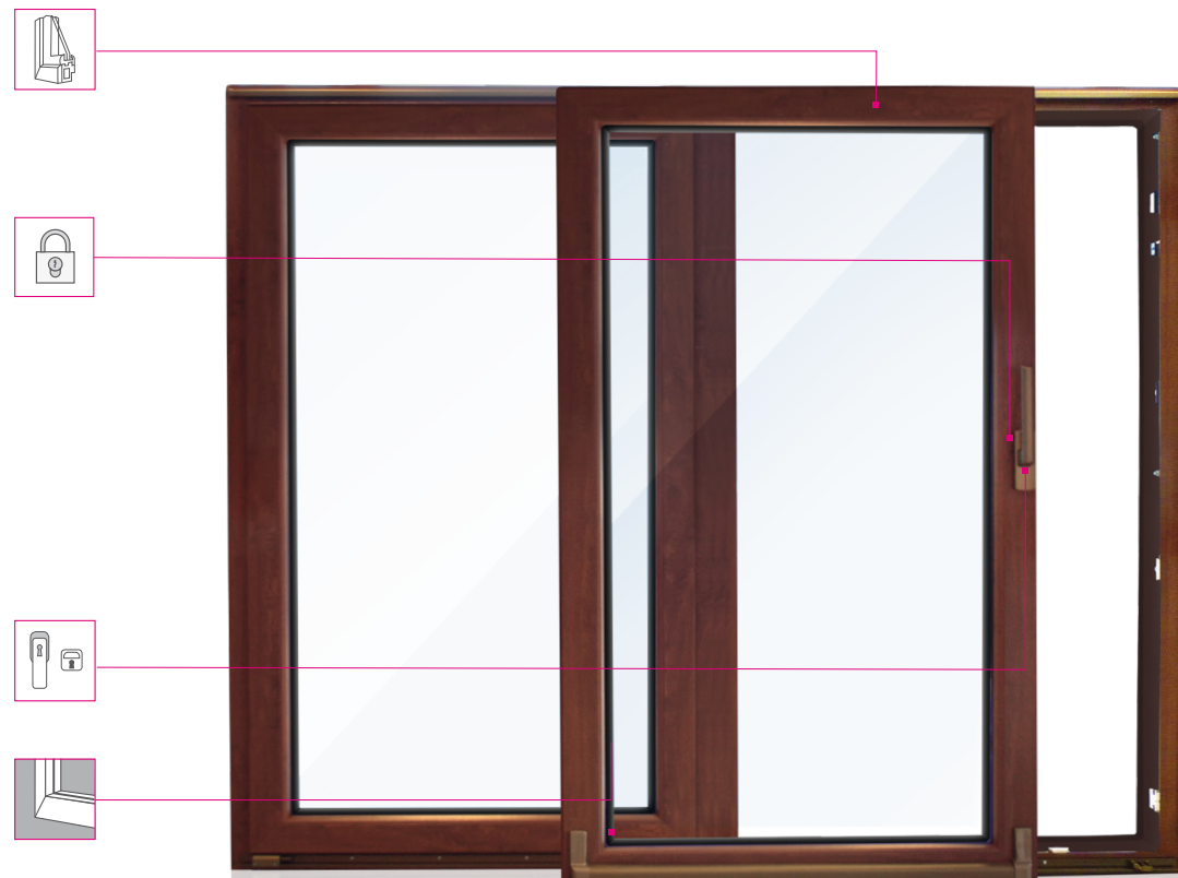
Model posuvných dveří prezentovaný v třídě SILVER

Vyrobené z trvanlivé kaučukové a silikonové hmoty s vysokou odolností proti UV záření.